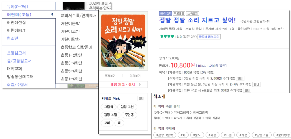
〈그림 2〉 교보문고 어린이(초등) 메뉴 및 서지정보 화면

또한, 각 그림책마다 '주제어'와 '키워드'가 부여되어 있어서 주제나 키워드로 검색하는 것이 가능하다. 교보문고 사이트에서 '분노 그림책'이라는 키워드로 검색해본 결과, '정말 정말 소리 지르고 싶어!', '성질 좀 부리지 마, 님스!' 등 분노조절과 관련한 그림책들이 검색되었다. '정말 정말 소리지르고 싶어!' 도서의 서지정보 화면에서 보이는 '키워드 Pick'은 AI엔진이 교보문고에 등록된 모든 도서의 정보(제목, 책 소개 내용, 출판사 서평, 회원 리뷰 등)를 분석하여 각 도서가 다루고 있는 주제를 파악하여 대표 키워드로 추출한 것이다. 이외는 별도로, 주제어로 '분노', '화', '짜증', '감정조절' 등이 부여되어 있는데 이는 교보문고의 도서 등록 담당자가 도서 주제를 분석한 결과 혹은 출판사의 요청에 따라 수기로 입력하는 주제어들이다. '키워드 Pick'과 '주제어'는 모두 하이퍼링크로 연결되어 동일한 키워드나 주제어를 갖는 도서를 한꺼번에 볼 수 있다. 이와 더불어, '미리보기' 기능을 통해 글밥과 그림체를 확인할 수 있